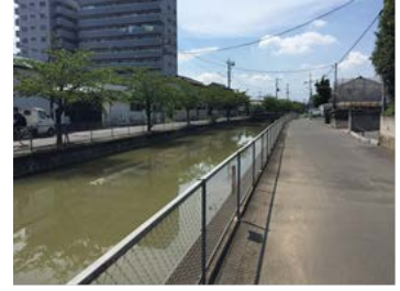
図6 市街地 (地点④)

地点①…会の川の起点は、どの水路にもつながっておらず、急に始まっている。水の流れもないため、川の水は澱んでいて濁っていた。地点②…多数の用水路から会の川に流入し、水量が大幅に増えている。地点③…志多見砂丘が見られる。水量は地点②とほぼ同じである。地点④…市街地を流れる。川岸はコンクリートで固められている。一部は蓋をされ、上部が公園となっている。地点⑤…北側用水路に流れ込んでいる。