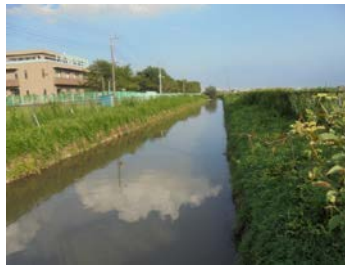
図5 水田地帯 (地点②)