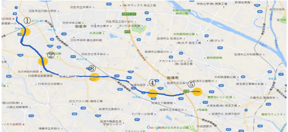
図3 「会の川」調査ポイント (Google マップを利用)